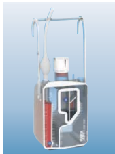
XL2000S Z kontrolą ssania