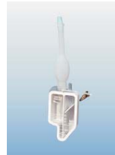
XS50 - ambulatoryjny