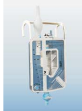
XL200 - pediatryczny