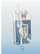
XL200S - pediatryczny z kontrolą ssania